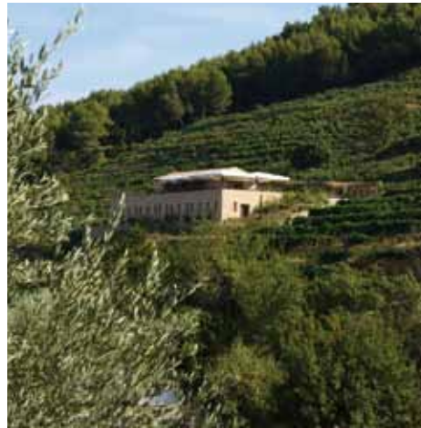
Domaine Font des Pères - Le Beausset (83)