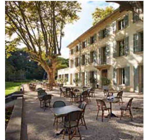
Domaine Fontenille - Lauris (84)