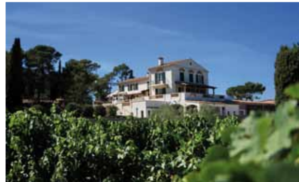
Château la Navicelle - Le Pradet (83)