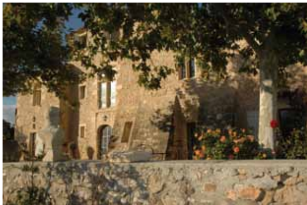
Domaine du Grand Calamant - Pertuis (84)