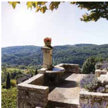
Domaine du Dragon - Draguignan (83)