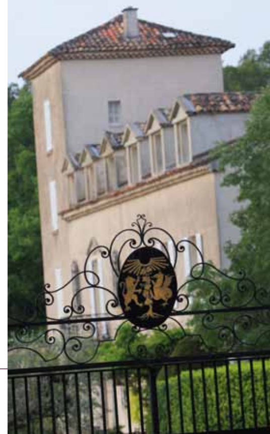
Château Roubine - Lorgues (83)

10 000 SPECTACTEURS SONT ATTENDUS POUR L'ÉDITION 2020