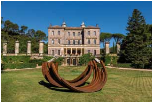
Château d'Astros-Vidauban (83)