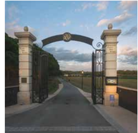
Clos des Roses - Fréjus (83)