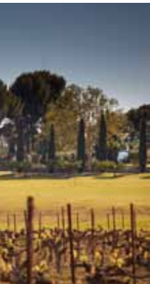
Château Saint-Maur - Cogolin (83)