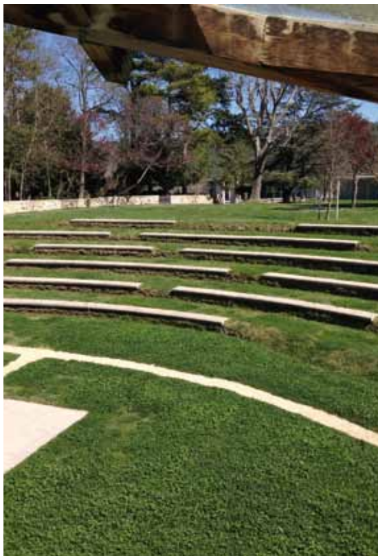
Château La Coste - Aix-en-Provence (13)