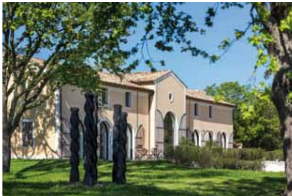
Domaine de Souviou - le Beausset (83)