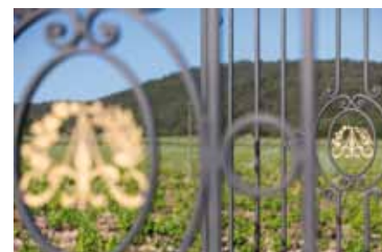
Château de l'Aumérade - Pierrefeu (83)