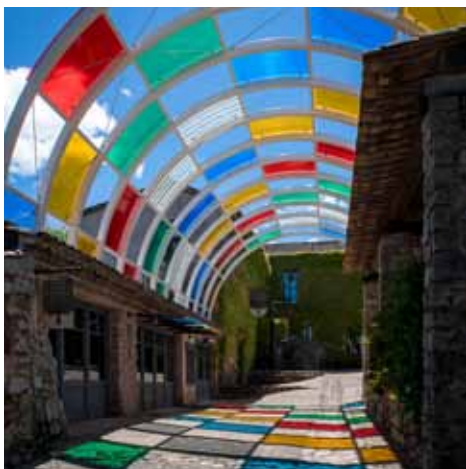
La Commanderie de Peyrassol Flassans-sur-Issole (83)