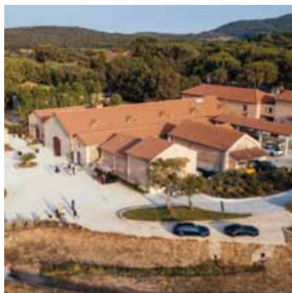
Domaine du Bourrian - Gassin (83)