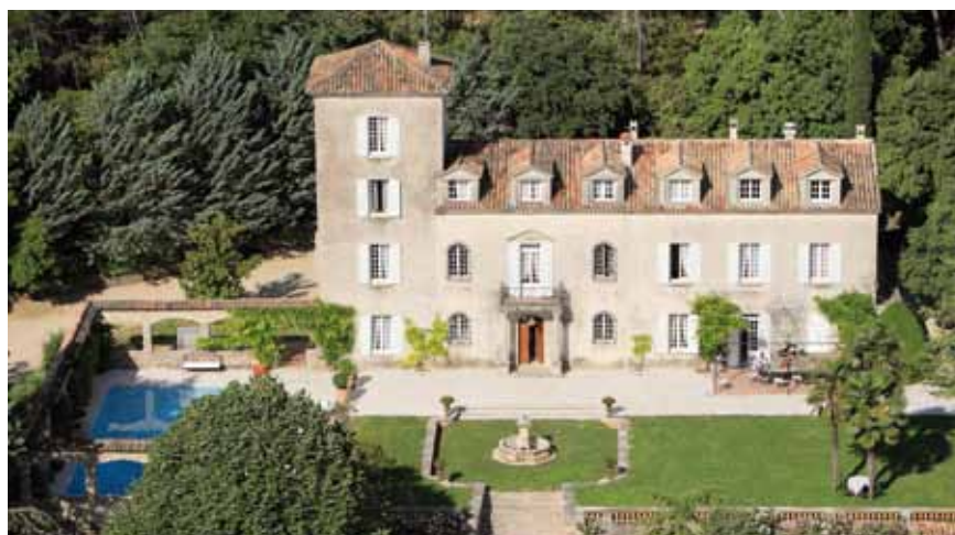
Château Roubine - 83 Lorgues

CETTE ANNÉE, NOUS INVITONS UN ORCHESTRE SYMPHONIQUE DE JEUNES DU DANEMARK QUI INTERPRÉTERONT LA 5ÈME SYMPHONIE DE BEETHOVEN