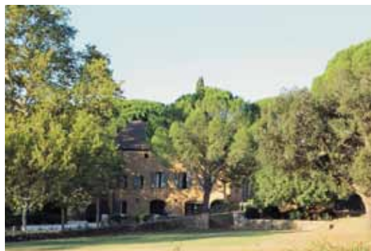
Domaine Sainte Marie Bormes-les-Mimosas (83)