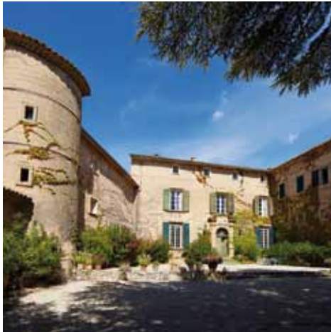
Château-du-Seuil - Aix-en-Provence (13)