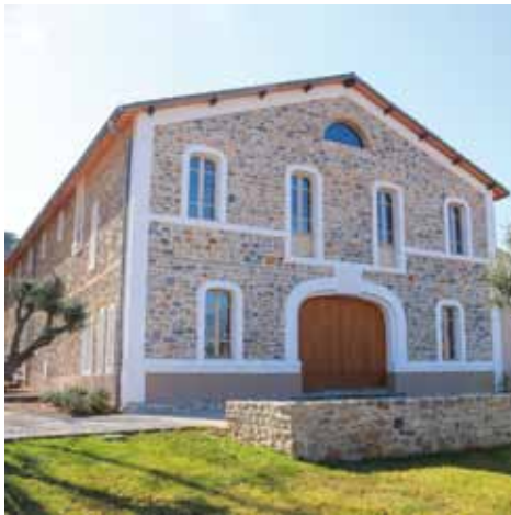
Château de l'Escarelle - La Celle (83)