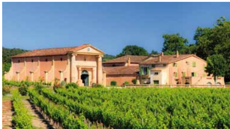
Domaine Bertaud Belieu - Gassin (83)